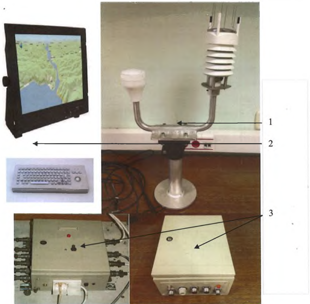
Рисунок 1 – Общий вид комплексов «Сюжет-КМ». 1 – модуль измерительный, 2 – модуль отображения и регистрации данных, 3 – модуль сбора и обработки данных.